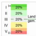
Figuur SEQ/Figuur 1* ANADIC 1: normtabel Cito